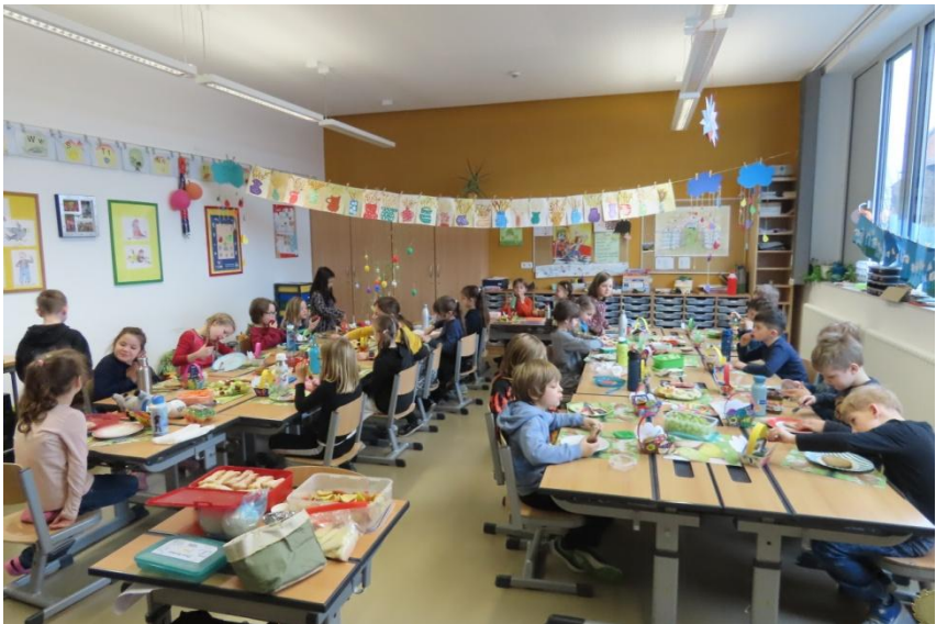
Osterprojekttag in der Klasse 1b