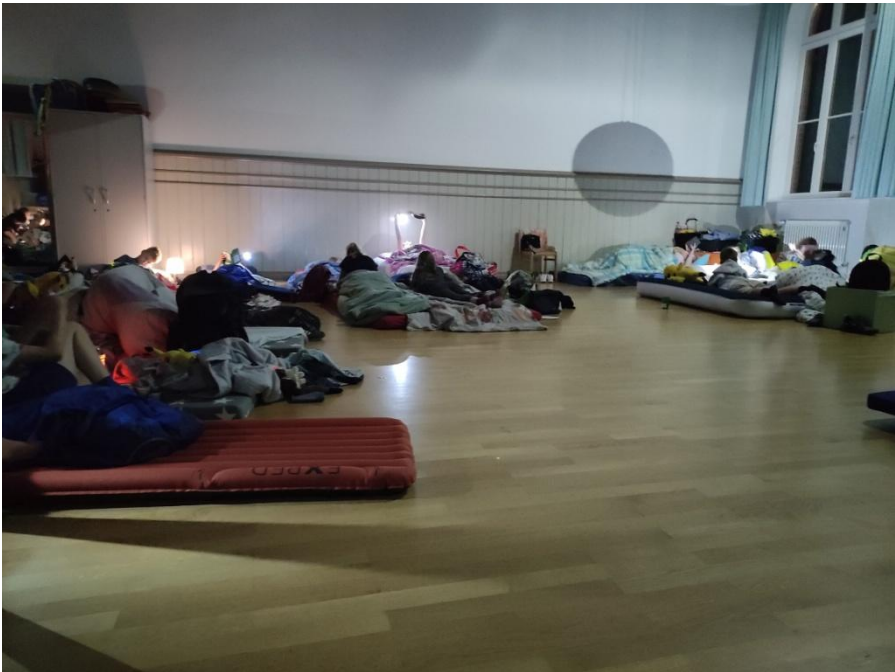
Lesenacht der Klasse 3d im Bewegungsraum vom Hort

Es wurde gespielt, Pizza gegessen, vorgelesen und dann durften alle mit Stirnlampen so lange lesen wie sie wollten. Beiden dritten Klassen hat das gut gefallen.